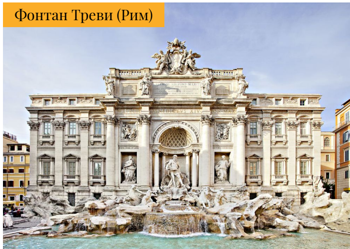
Фонтан Треви (Рим)