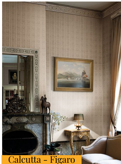
Calcutta - Figaro