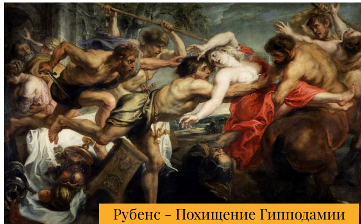
Рубенс - Похищение Гипподамии