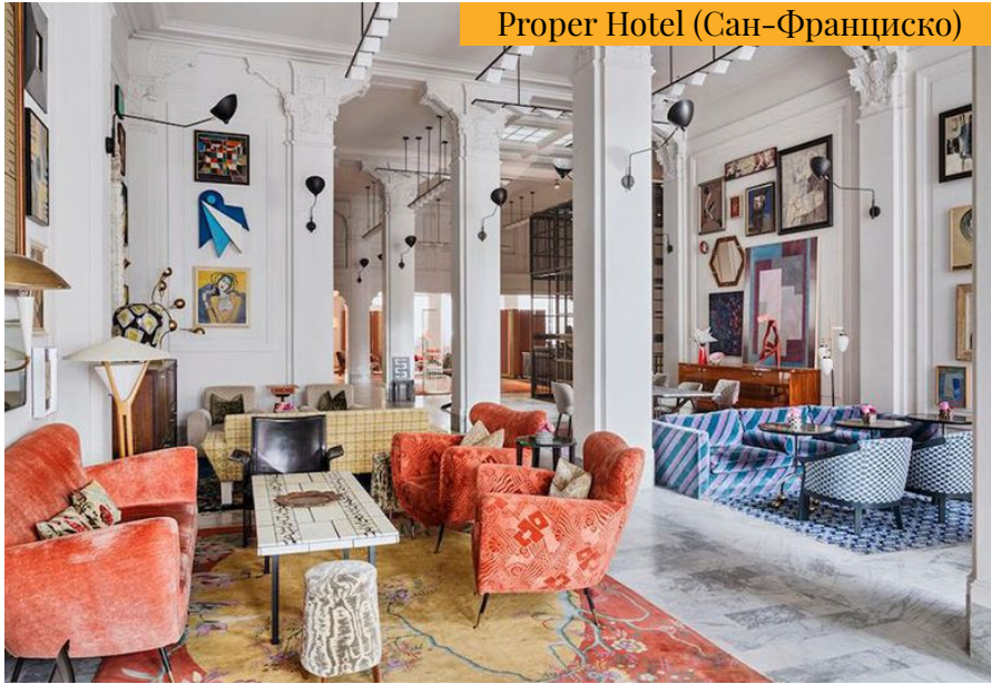
Proper Hotel (Сан-Франциско)