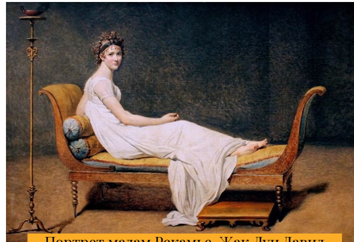
Портрет мадам Рекамье-Жак Луи Давид