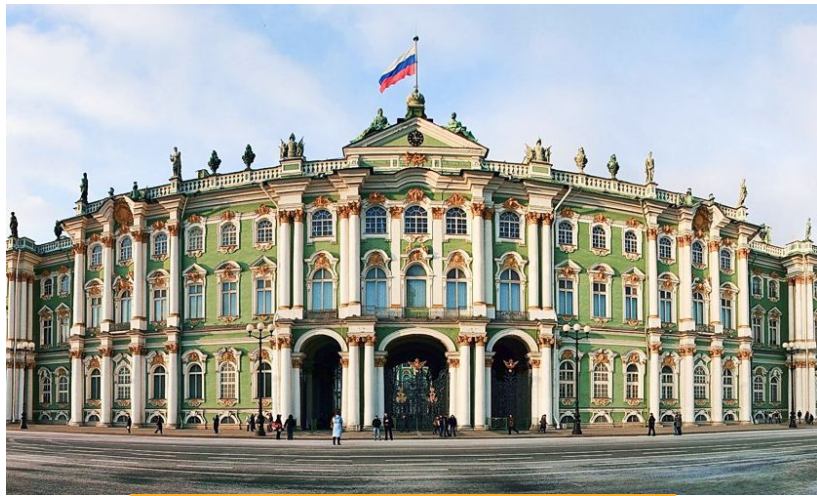
Зимний дворец (Санкт-Петербург)