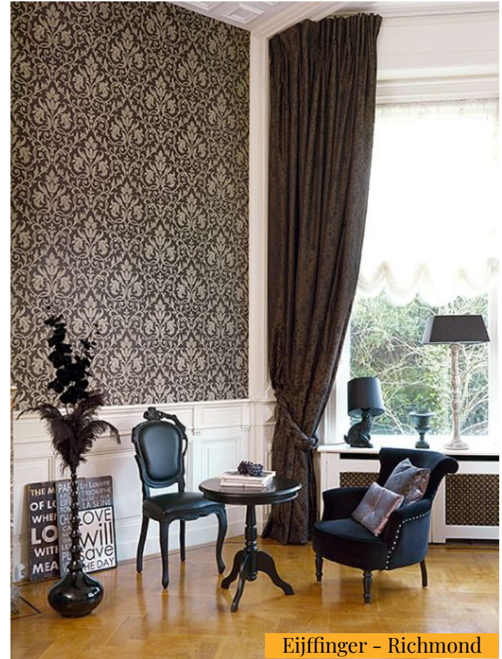
Eijffinger - Richmond