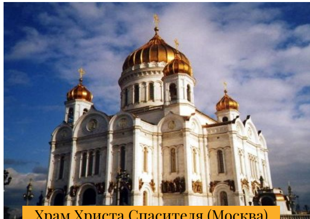
Храм Христа Спасителя (Москва)