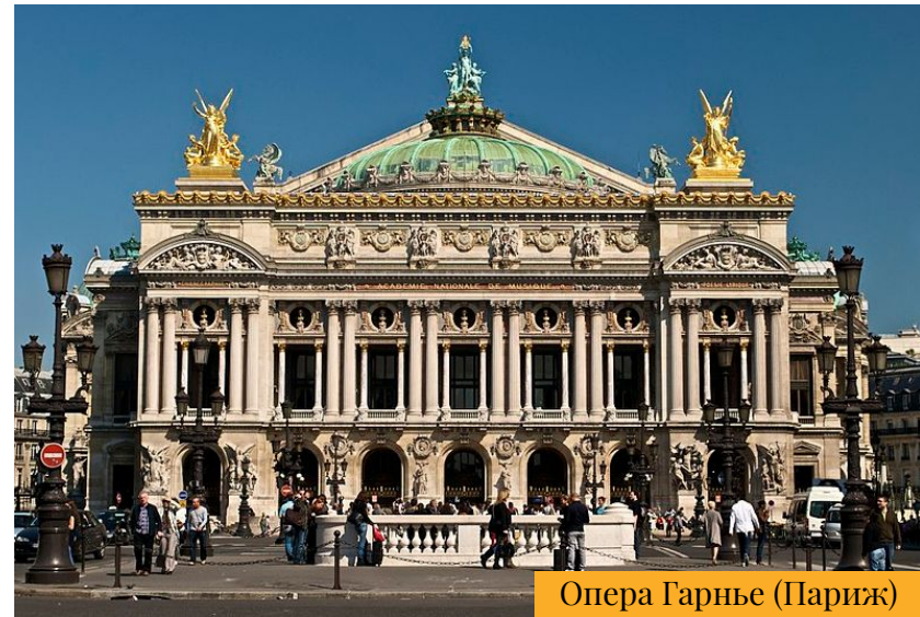
Опера Гарнье (Париж)