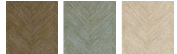
Полосы с имитацией коры бананового дерева