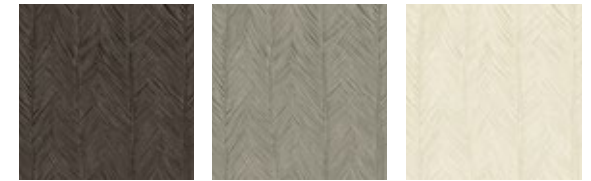
Вертикальный узор из пальмовых листьев