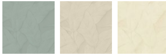
Заросли банановых деревьев