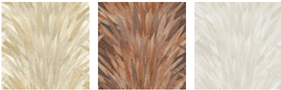
Дорожки из листьев пандана в технике аппликации